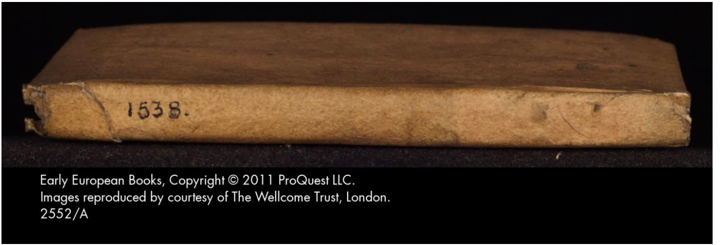
Early European Books, Copyright © 2011 ProQuest LLC. Images reproduced by courtesy of The Wellcome Trust, London. 2552/A